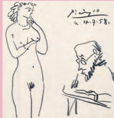
Pablo Picasso (1881, Malaga – 1973, Mougins) Le peintre et son modèle / Der Maler und sein Modell 1958, Zeichnung

Maria Gutiérrez Blanchard studiert zunächst in San Fernando und, dank eines Stipendiums, ab 1909 in Paris. Hier entdeckt sie für sich die Malerei des Kubismus, insbesondere wird sie von Jacques Lipchitz und Juan Gris beeinflusst. Nach zahlreichen Erfolgen ist ihr späteres Leben von Einsamkeit, Krankheit und finanziellen Problemen geprägt.