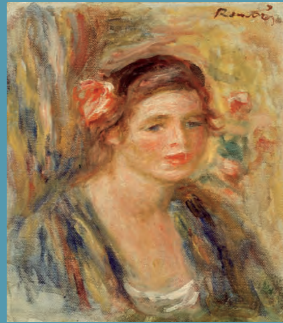
Pierre Auguste Renoir (1841, Limoges – 1919, Cagnes-sur-mer) Gabrielle / Gabrielle, 1910, Öl auf Leinwand