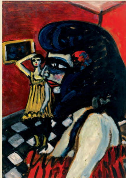
Auguste Chabaud (1882, Nîmes – 1955, Graveson) Yvette / Yvette, 1907, Öl auf Karton

Camoin wird in ärmlichen Verhältnissen geboren. Er studiert in Paris bei Gustave Moreau, schließt Freundschaft mit Albert Marquet und Paul Cézanne und gehört zu den Schlüsselfiguren des Fauvismus. Seine Motive findet er vor allem in den Varietés und Cafés von Paris. Um 1932 zerstört er aus Selbstzweifel mehr als 80 seiner Gemälde. Er ist bis ins hohe Alter künstlerisch aktiv und erfolgreich.