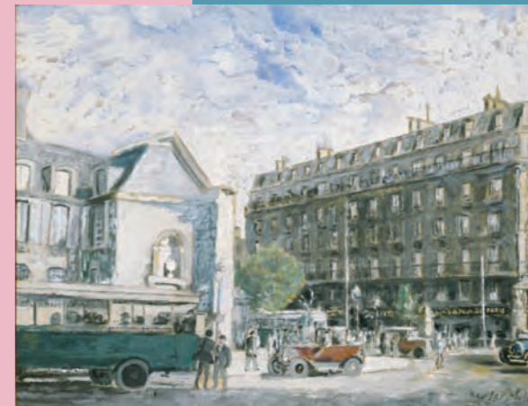
Max Jacob (1876, Quimper – 1944, Sammellager Drancy) Saint Germain des Prés / Saint Germain des Prés, 1931, Gouache

lerbezirke Montmartre und Montparnasse. Dabei standen nicht allein die künstlerischen Strategien und die Verschiedenartigkeit der bildnerischen Mittel im Vordergrund, sondern auch die Künstler selbst, deren Herkunft und Zugehörigkeit zu bestimmten Gruppierungen. Die Ausstellung zeigt das vielstimmige Leben dieser Jahre und spürt den Zusammenhängen von Werken und Schick-