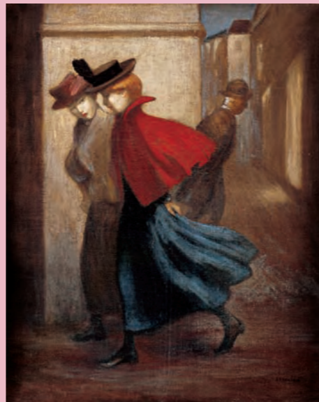
Théophile-Alexandre Steinlen (1859, Lausanne – 1923, Paris) Les deux Parisiennes / Die zwei Pariserinnen, 1902, Öl auf Leinwand

Steinlen wird in einer Künstlerfamilie geboren. 1881 geht er nach Paris und findet schnell Kontakt zu anderen Künstlern. Er entwirft zahlreiche Plakate, illustriert die Zeitung Le Chat noir und zahlreiche Bücher. Er ist vor allem als Zeichner bekannt und widmet sich oft sozialkritischen Themen.