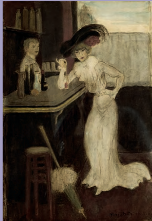
George Bottini (1877, Villejuif – 1907) Femme au bar avec ombrelle / Frau mit Sonnenschirm an der Bar, 1907, Aquarell

schied zu anderen Schulen beschreibt die École de Paris jedoch weder eine einheitliche Stilrichtung noch eine programmatisch miteinander verbundene Künstlergemeinschaft. Man bezeichnet damit die Gesamtheit der zu dieser Zeit in Paris arbeitenden Künstler. In diesem Schmelztiegel der Nationen revolutionierte man mit hellen, leuchtenden Farben und kurzen Pinselstrichen die Kunst und schockierte oftmals das Publikum. Mensch und Landschaft galten nicht mehr als gottgegebenes Maß aller Dinge und die austemperierten Kompositionen wurden durch das vom Künstler frei gewählte Motiv ersetzt. Man strebte nach unmittelbarer Sinneswahrnehmung, nach einer Ehrlichkeit des Auges, die sich ohne vor- oder nachträgliche Überlegung vermitteln sollte. Die Maler suchten nach einer neuen Form des Sehens im Licht, in dem sich alles aus Teilen fügt und die persönliche Erregung des Künstlers die Form bestimmt. Man entdeckte die Bewegung, versuchte den Schwingungen Raum zu geben, überwand feste Geometrien und lineares Denken – und machte sich die Erkenntnisse der Naturwissenschaften zu eigen. Wenig später zerlegten die Neoimpressionisten die Dinge in einzelne Farbpunkte, malten nahezu abstrakte, vibrierende Flächen, bei denen sich die Farben erst in einiger Entfernung im Auge des Betrachters mischen