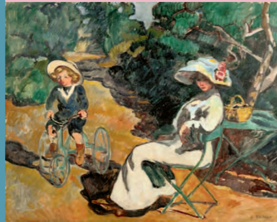
Louis Valtat (1869, Dieppe – 1952, Paris) L'enfant au tricycle / Das Kind auf dem Dreirad, 1912, Öl auf Leinwand