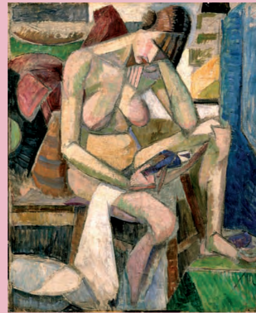
Albert Gleizes (1881, Paris – 1953, Saint-Rémy-de-Provence) Nu assis / Sitzender Akt, 1909, Öl auf Leinwand

Albert Gleizes ist nicht nur als kubistischer Maler, sondern auch als Essayist bekannt. Er ist Mitbegründer des Salon d'Automne und beteiligte sich an den Ausstellungen im Salon des Indépendants. Er ist ein Wegbereiter der Abstraktion.