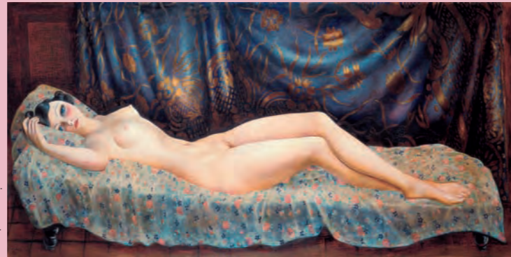
Moïse Kisling (1891, Krakau – 1953, Sanary-sur-mer), Nu d'Arletty / Akt Arletty, 1933, Öl auf Leinwand

Elisée Maclet ist der Sohn eines Gärtners und wächst in ärmlichen Verhältnissen auf. In dem Maler Puvis de Chavannes findet er einen prominenten Lehrer und Förderer, der ihn schließlich zum Wechsel nach Paris ermuntert. Maclet führt ein sehr unbeständiges Leben, muss allerlei anderen Broterwerben nachgehen, bevor er im fortgeschrittenen Alter Erfolg hat.