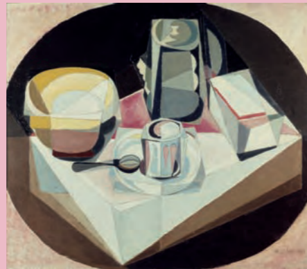
Maria Blanchard (1881, Santander – 1932, Paris) Nature morte / Stilleben, 1917, Öl auf Holz

Moïse Kisling sollte Ingenieur werden, kann jedoch ab seinem 15. Lebensjahr an der Kunstakademie in Krakau studieren. 1910 zieht er nach Paris und orientiert sich an verschiedenen Richtungen. Er ist mit André Derain, Pablo Picasso, Amedeo Modigliani, Juan Gris, Max Jacob und Jean Cocteau befreundet und zu Lebzeiten einer der bekanntesten Maler zwischen Montmartre und Montparnasse.