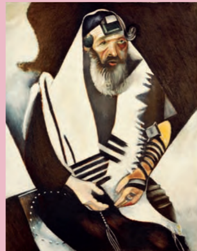
Marc Chagall (1887, Witebsk – 1985, Saint-Paul-de-Vence) Le Rabbin / Der Rabbiner, 1914, Radierung

Auguste Elysée Chabaud studiert in Avignon und Paris und lernt Henri Matisse, André Derain und Jean Puy kennen. Seine bevorzugten Motive sind Szenen am Montmartre, Can-Can-Tänzerinnen, Gaukler und Clowns. Die erste Einzelausstellung hat er 1912 in der Galerie Bernheim-Jeune in Paris. 1919 zieht er in die Provence, wo er den Rest seines Lebens verbringt und die Landschaft als Motiv entdeckt.