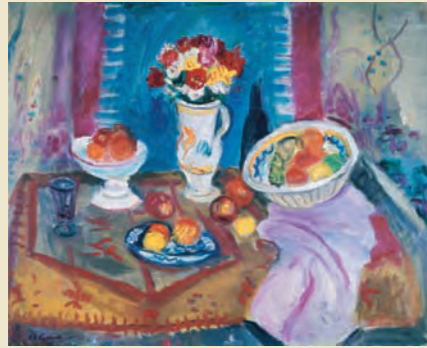
Charles Camoin (1879, Marseille – 1965, Paris), Nature morte au linge rose / Stilleben mit rosa Wäsche, o. J., Öl auf Leinwand