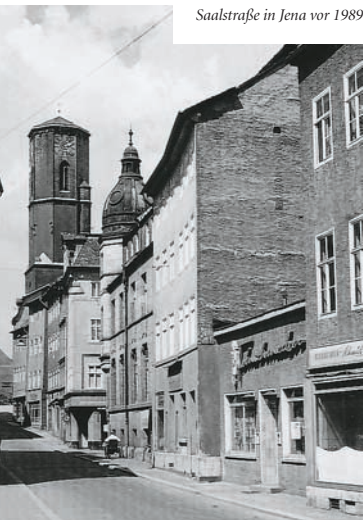
Saalstraße in Jena vor 1989

Die Volkskammer wählt Hans Modrow zum neuen Ministerpräsidenten.